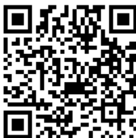
Рис.1. QR код мобильного приложения

Сканируйте камерой телефона QR код (рис. 1)